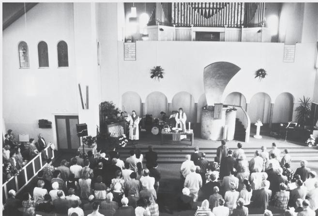
Exoduskerkdienst in de Valkenboskerk in Den Haag

We bereidden de diensten meestal voor met de bewoners. In een dienst die ik zou leiden ging het over een vraag van Jezus aan vissers om 's morgens vroeg de zee op te gaan. (Lucas 5:1-11) 64 Ze waren net teruggekeerd en ze hadden niets gevangen. Alles wat ze gedaan hadden was voor niets geweest. Ze hadden net zo goed thuis kunnen blijven. En dan zegt Jezus: 'Vaar naar diep water en gooi jullie netten uit om vis te vangen'. (Lucas 5:4)