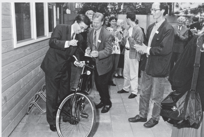
Opening fietsenmakerij Exodus Den Haag

In het Exodushuis in Den Haag begonnen we met een eigen fietsenmakerij. De bewoners werkten daar de eerste periode van hun verblijf in huis. Ze leerden er het wennen aan een werkritme, sleutelen, omgaan met elkaar en met de klanten. Bijzonder aan de fietsenmakerij was dat het een buurtfunctie kreeg. Buurtbewoners kochten er opgeknapte tweedehands fietsen. We kochten ze met tientallen tegelijk in bij de politie. Het waren gestolen of gevonden fietsen, waarvan de eigenaar onbekend was. Ook werden er fietsen voor reparatie gebracht. Door de fietsenmakerij kreeg Exodus ook betekenis in de buurt.