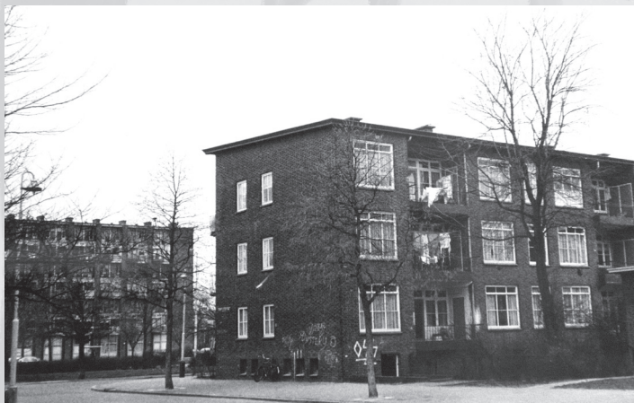
Kelder onder flatgebouw waar het Open Huis van Exodus Den Haag begon

In de Roemer Visscherstraat in Den Haag-Moerwijk stond onder een flatgebouw een grote kelder leeg. Het was in de buurt waarin ik ben opgegroeid. De kelder was altijd gebruikt voor kerkelijk jeugdwerk. Ik vroeg aan de leiding van het jeugdwerk of de kelder beschikbaar kon komen voor een opvangproject voor ex-gedetineerden. Dat was direct goed en huur hoefden we ook niet te betalen. Dit is jeugdwerk bij uitstek, werd er gezegd. Een stimulerend begin! Vrijwilligers maakten er een Open Huis van met een huiskamer, een creativiteitswerkplaats, een keuken en een kleine winkel in de hal. Geld kwam van de kerk, van fondsen en van particulieren.