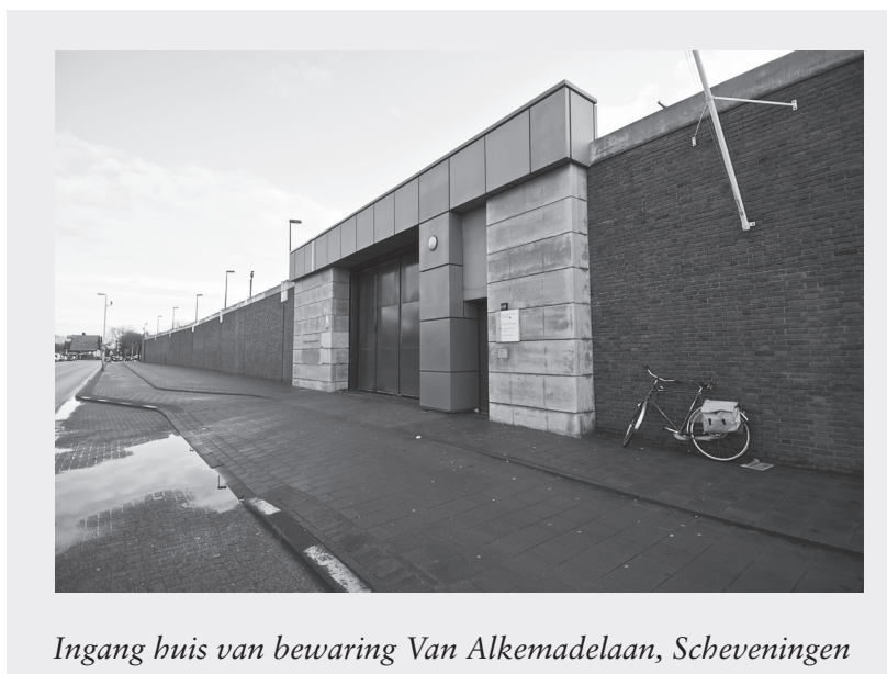
Ingang huis van bewaring Van Alkemadelaan, Scheveningen

Sinds 1983 werkte ik in Scheveningen naast de gevangenis ook in het huis van bewaring aan de Van Alkemadelaan. Het huis van bewaring heeft een lange geschiedenis. Het wordt ook wel het Oranjehotel genoemd, omdat er in de Tweede Wereldoorlog veel verzetsmensen ingesloten werden. Hier hebben in de oorlog zo'n 30.000 personen vastgezeten. Binnen en buiten herinneren monumenten aan de oorlogstijd. Eén cel is nog altijd intact gebleven. Dat is de Dodencel 601. Daar brachten de verzetsmensen hun laatste nacht door voordat ze werden gefusilleerd op de Waalsdorpervlakte.