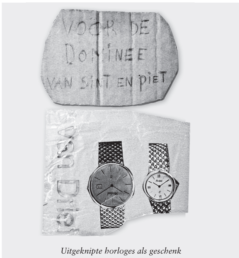
Uitgeknipte horloges als geschenk