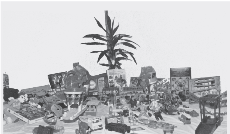
Speelgoedproject huis van bewaring 's-Hertogenbosch

Er kwam heel veel gebruikt speelgoed binnen. Een gedetineerde, afkomstig van het woonwagenkamp, zorgde voor een vrachtwagen vol. Hij had z'n hele familie ingeschakeld. Iedere dinsdagavond werd gewerkt aan 'het speelgoedproject'. Het was gezellig en er was grote betrokkenheid. Regelmatig werd op zondag het gerestaureerde speelgoed voor in de kerk uitgesteld. Door de intensieve aandacht die het gekregen had, zag het er weer als nieuw uit. Tijdens de dienst van de gaven werd het dan met een speciale tekst erbij gezonden naar Casa Materna. Vanuit Napels ontvingen we foto's. Het was goed om te weten en vooral te zien hoe het speelgoed werd gebruikt en dat het zin heeft om je ergens voor in te zetten.