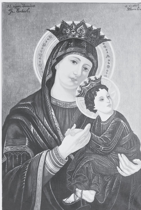
Madonna van Milan